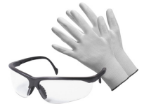
Gants et lunettes de protection