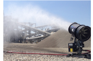
Brumisateur haute pression