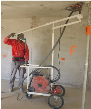
Poste de ponçage intégré (ponceuse, aspirateur, chariot mobile)