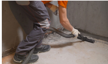
Nettoyage de chantier