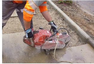
Machine avec système d'abattage à l'humide

Nettoyer les espaces de travail par aspiration.